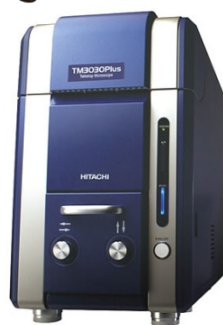
(体験機器イメージ)