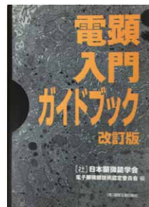
電顕入門ガイドブック

本学会では顕微鏡技術の向上のため技術者の育成に取り組んでいます。学術講演会や研究分科会のセミナーやチュートリアルをはじめ、各分野の専門家を講師とした「電子顕微鏡大学」や大学・民間の研究者による「電顕サマースクール」を開催して、顕微鏡法の学理や機器操作の実務を習得する場を提供しています。関東支部会が中心となって試料前処理を含む実技講習会も行っています。毎年秋季、全国3会場(東京・京都・福岡)において電子顕微鏡技術認定試験を実施し、一定以上の知識と技量を有する方を電子顕微鏡技士(一級、二級)に認定しています。また初学者向けの「電顕入門ガイドブック」や生物試料前処理DVD「電子顕微鏡解析技術」などの監修も行い、顕微鏡技術の普及も積極的に進めています。