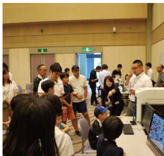
市民ワークショップ